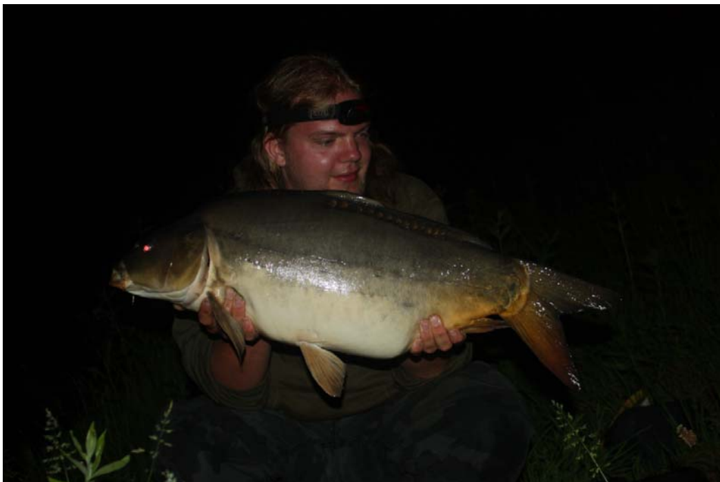
Vis nummer 135, uitgezet in Goor in 2011 en destijds de eerste vis die op een ander stuwvak gevangen werd zwemt nog steeds op TK2. Hoewel met de groei in gewicht niets mis is, is het vooral de forse lentegroei die opvalt: deze vis mat al 76cm in juni.