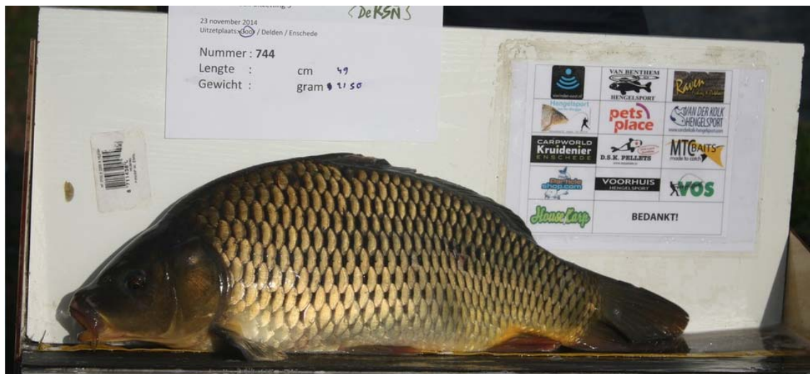
Schubkarper geleverd door Viskweekcentrum Valkenswaard. Hoewel schubkarpers uiterlijk sterk op elkaar lijken zijn er altijd wel onregelmatigheden in het schubbenpatroon te vinden waaraan een vis individueel te herkennen is.