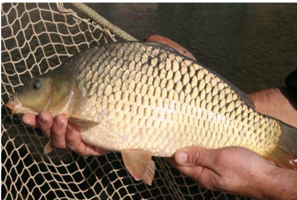
Hooggebouwd model schubkarper van Carpfarm

Ook staat voor eind 2015 de laatste uitzetting van het huidige SKP op het programma. Hiervoor zullen wij de vissen bestellen bij Carpfarm. De goede groei en overleving, naast een soepele levering van gezonde vissen, geven hiervoor de doorslag. Net als in 2014 zal de helft van de uitzetting bestaan uit spiegelkarpers en de andere helft uit schubkarpers.