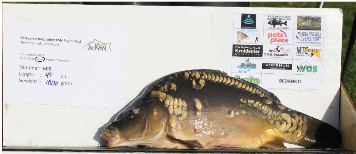
Duitse spiegelkarper geleverd door viskweekcentrum Valkenswaard. De vis heeft behoorlijk veel schubben, is hierdoor goed individueel herkenbaar en wordt door vissers als mooier ervaren dan een kale vis.