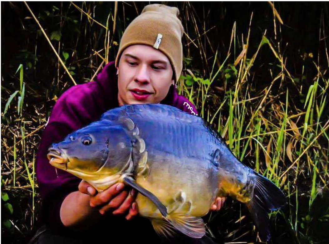
Bram ving vis 383 in het najaar, duidelijk in blakende gezondheid. Hopelijk groeit deze mooie spiegelkarper uit tot één van de toekomstige toppers op het Twentekanaal!