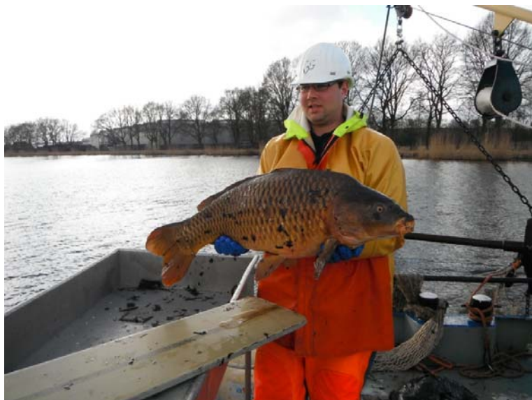
Eén van de grote jongens gevangen tijdens de MWTL-bemonstering

In maart 2015 werd op het Twentekanaal een MWTL bemonstering uitgevoerd. Vanuit De KSN regio Oost hebben wij contact opgenomen met de projectleider en gevraagd om gevangen karpers te fotograferen. Van tevoren wisten wij uit ervaring dat bij dit soort visstandbemonstering vaak weinig karpers wordt gevangen. Uiteindelijk bleken er 4 karpers gevangen: twee grote schubkarpers en 2 kleine spiegelkarpertjes. Een van deze vissen is gefotografeerd en blijkt een recente uitzetter te zijn.