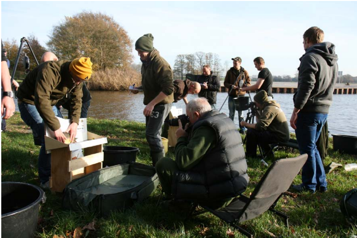
Het centrale meet- weeg- en fotopunt aan de zijtak bij Almelo-Zuid tijdens de uitzetting op 23 november 2014. Door 3 fotostations te gebruiken neemt de gehele uitzetting hooguit anderhalf uur in beslag.

De geleverde vis van Viskweekcentrum Valkenswaard was qua beschubbing zeer mooi te noemen. Veel vissen waren zeer goed individueel te herkennen en hadden vrij veel schubben. Ook over het formaat, gemiddeld 1466 gram, waren wij zeer te spreken. Anderhalve kilo wordt als ideaal beschouwd: groot genoeg om predatie van snoek en aalscholver te kunnen weerstaan. Bij kleinere vissen is de kans op uitval groter, bij grotere vissen betekent het dat er minder vissen worden uitgezet. Als minpunt kan genoemd worden dat de vissen vergeleken met vorige leveringen relatief meer beschadigingen vertoonden. De vis is na de reis uit Duitsland eerst een week opgeslagen in Valkenswaard en dat komt de vitaliteit van de vis uiteraard niet ten goede. Zoals elk jaar is ook dit jaar het percentage 'mooi beschubde vissen' geturfd. De resultaten hiervan staan in onderstaande tabel: