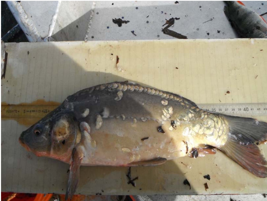
Vis nummer 723, recent uitgezet op 38cm.